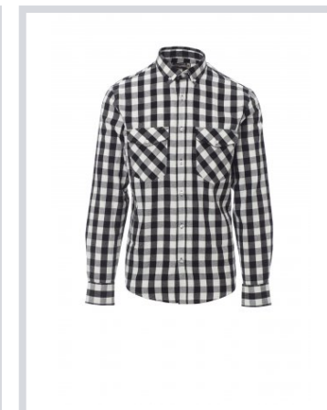
NERO/BIANCO A QUADRI